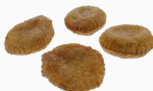
Appelbeignets (4 stuks)