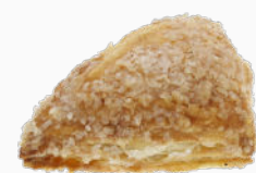
Mini appelflap gesuikerd