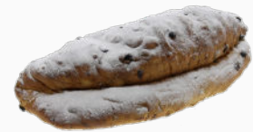
Roomboter stol middel met amandelspijs

750g in zak : Art.nr. 57020 750g in doos : Art.nr. 57025