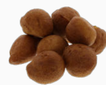
10x Oliebol naturel