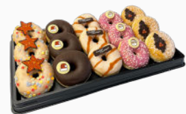
Box luxe mini kerstdonuts (15 stuks)