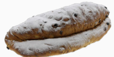
Roomboter stol extra groot zonder amandelspijs

1200g in zak : Art.nr. 57030 1200g in doos : Art.nr. 57035