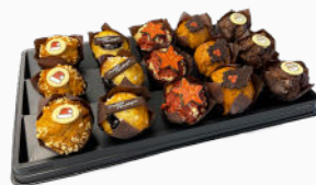
Box luxe mini kerstmuffins (15 stuks)