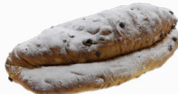
Roomboter stol extra groot met amandelspijs

1000g in zak : Art.nr. 57060 1000g in doos : Art.nr. 57065