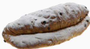
Roomboter stol groot met amandelspijs

750g in zak : Art.nr. 57020 750g in doos : Art.nr. 57025