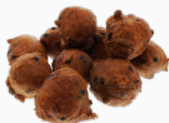
10x Oliebol krenten / rozijnen / appel